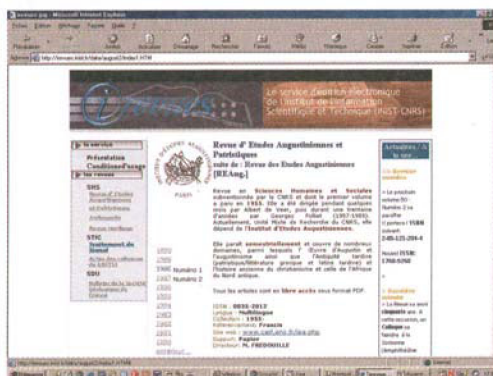
Figure 2 -Future version de la page d'accueil de la revue

Sans rentrer dans les aspects techniques, nous pouvons en effet préciser que d'ici à la fin de 2004, les pages du site I-Revues seront plus dynamiques et enrichies d'informations relatives à la vie des revues.